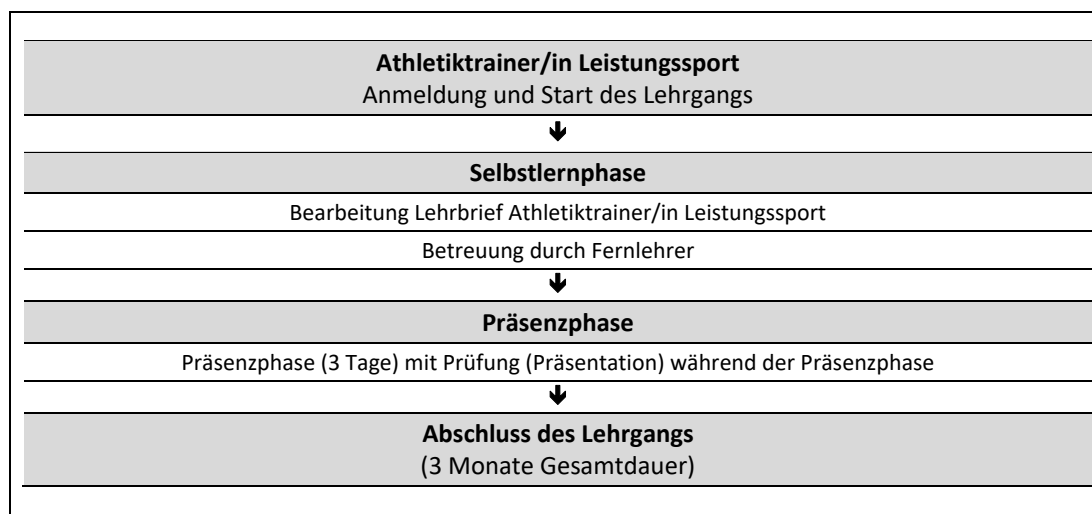
Abb. 1: Zeitliche Abfolge der Lernphasen

Die Regeldauer des Fernlehrgangs Athletiktrainer/in Leistungssport beträgt insgesamt 3 Monate. Eine Verlängerung der Gesamtdauer ist grundsätzlich auf das Doppelte der ursprünglichen Lehrgangsdauer ohne Angaben von Gründen und ohne Zusatzkosten möglich (bis maximal 6 Monate). Eine weitere Verlängerung der Lehrgangsdauer kann auf Antrag und unter Darlegung von Gründen im Individualfall gewährt werden. Im Falle einer zulässigen Verlängerung der Lehrgangsdauer, ist eine Betreuung durch die Fernlehrer (vgl. Kap. 3) in vollem Umfang ohne Zusatzkosten für Sie gewährleistet.