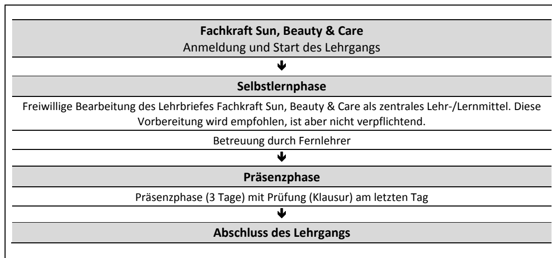
Abb. 1: Zeitliche Abfolge der Lernphasen

Die optimale zeitliche Abfolge der Lernphasen wird in Abb. 1 zusammenfassend dargestellt. Diese Abfolge kann jedoch aufgrund Ihrer individuellen Voraussetzungen und Möglichkeiten auch variiert werden.