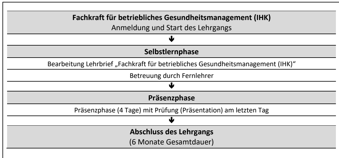
Abb. 1: Zeitliche Abfolge der Lernphasen

In Ihrem Fernlehrgang wird ein Lehrbrief als zentrales Lernmedium eingesetzt (vgl. Abb. 1 und Kap. 2.1).