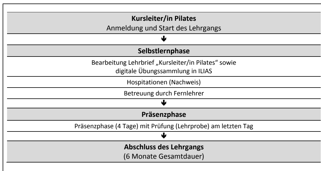
Abb. 1: Zeitliche Abfolge der Lernphasen

Die Regeldauer des Fernlehrgangs Kursleiter/in Pilates beträgt insgesamt 6 Monate. Eine Verlängerung der Gesamtdauer ist grundsätzlich auf das Doppelte der ursprünglichen Lehrgangsdauer ohne Angaben von Gründen und ohne Zusatzkosten möglich (bis maximal 12 Monate). Eine weitere Verlängerung der Lehrgangsdauer kann auf Antrag und unter Darlegung von Gründen im Individualfall gewährt werden. Im Falle einer zulässigen Verlängerung der Lehrgangsdauer, ist eine Betreuung durch die Fernlehrer (vgl. Kap. 3) in vollem Umfang ohne Zusatzkosten für Sie gewährleistet.