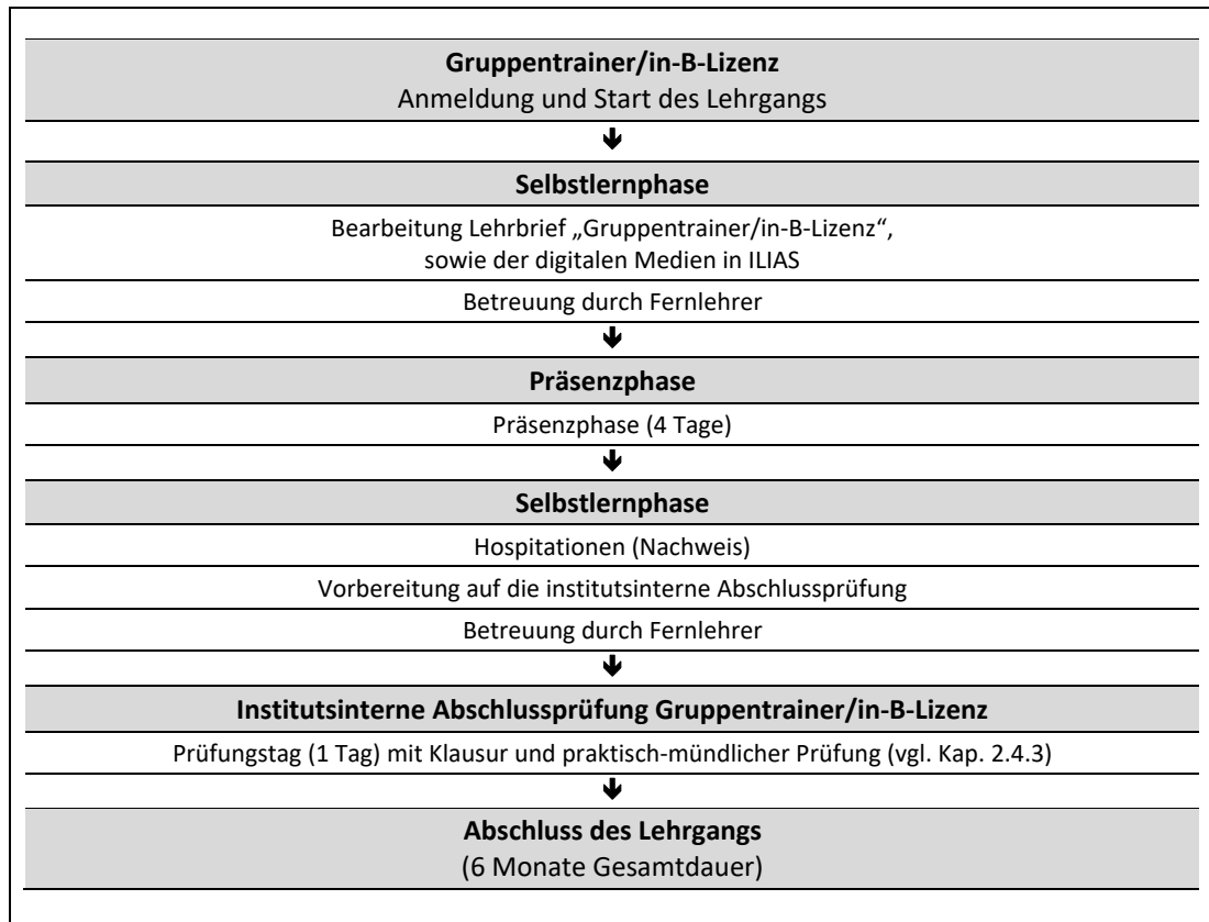
Abb. 1: Zeitliche Abfolge der Lernphasen

In Ihrem Fernlehrgang werden ein Lehrbrief und digitale Medien als zentrale Lernmedien eingesetzt (vgl. Abb. 1 und Kap. 2.1).