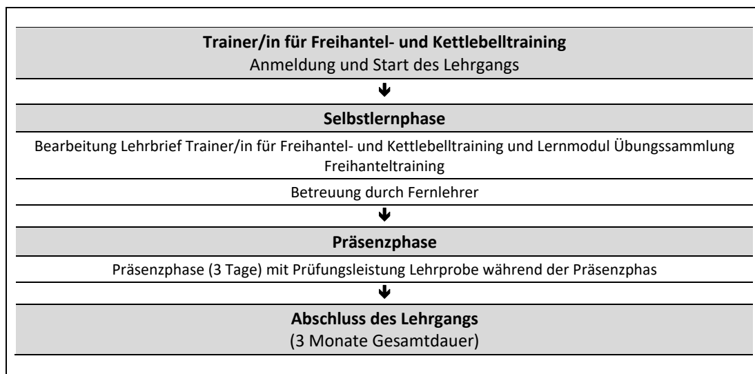
Abb. 1: Zeitliche Abfolge der Lernphasen

In Ihrem Fernlehrgang wird ein Lehrbrief als zentrales Lernmedium eingesetzt (vgl. Abb. 1 und Kap. 2.1). Des Weiteren haben Sie Zugriff auf ein digitales Lernmedium, das Lernmodul Übungssammlung Freihandeltraining (vgl. Kap. 2.3.1).