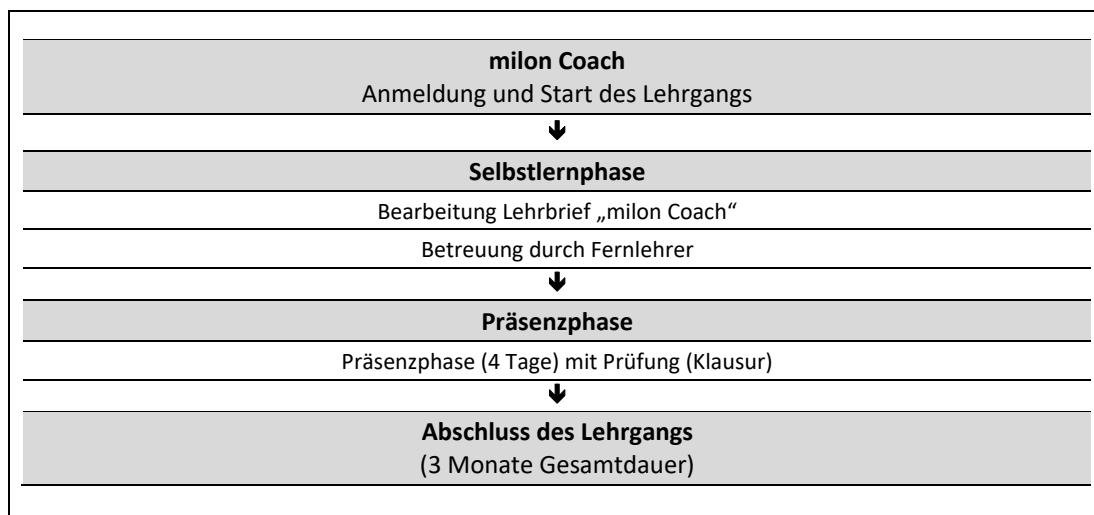
Abb. 1: Zeitliche Abfolge der Lernphasen

In Ihrem Fernlehrgang wird ein Lehrbrief als zentrales Lernmedium eingesetzt (vgl. Abb. 1 und Kap. 2.1).