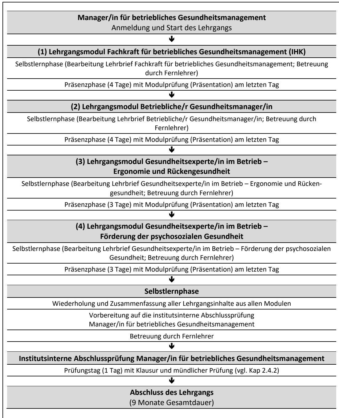
Abb. 1: Zeitliche Abfolge der Lehrgangsmodule und deren Lernphasen (inkl. Lernmedien und Präsenzphasen der Module)

In jedem Modul Ihres Fernlehrgangs werden Lehrbriefe als zentrale Lernmedien eingesetzt (vgl. Abb. 1 und Kap. 2.1).