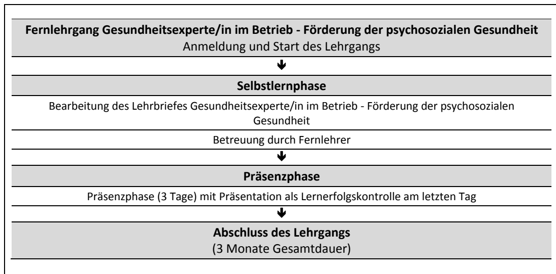
Abb. 1: Zeitliche Abfolge der Lernphasen

In Ihrem Fernlehrgang wird ein Lehrbrief als zentrales Lernmedium eingesetzt (vgl. Abb. 1 und Kap. 2.1).