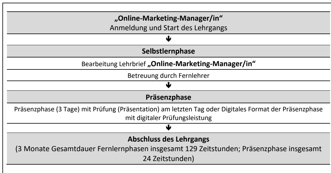
Abb. 2: Zeitliche Abfolge der Lernphasen

Die Regeldauer des Fernlehrgangs „Online-Marketing-Manager/in“ beträgt insgesamt 3 Monate. Eine Verlängerung der Gesamtdauer ist grundsätzlich auf das Doppelte der ursprünglichen Lehrgangsdauer ohne Angaben von Gründen und ohne Zusatzkosten möglich (bis maximal 6 Monate). Eine weitere Verlängerung der Lehrgangsdauer kann auf Antrag und unter Darlegung von Gründen im Individualfall gewährt werden. Im Falle einer zulässigen Verlängerung der Lehrgangsdauer, ist eine Betreuung durch die Fernlehrer (vgl. Kap. 3) in vollem Umfang ohne Zusatzkosten für Sie gewährleistet.