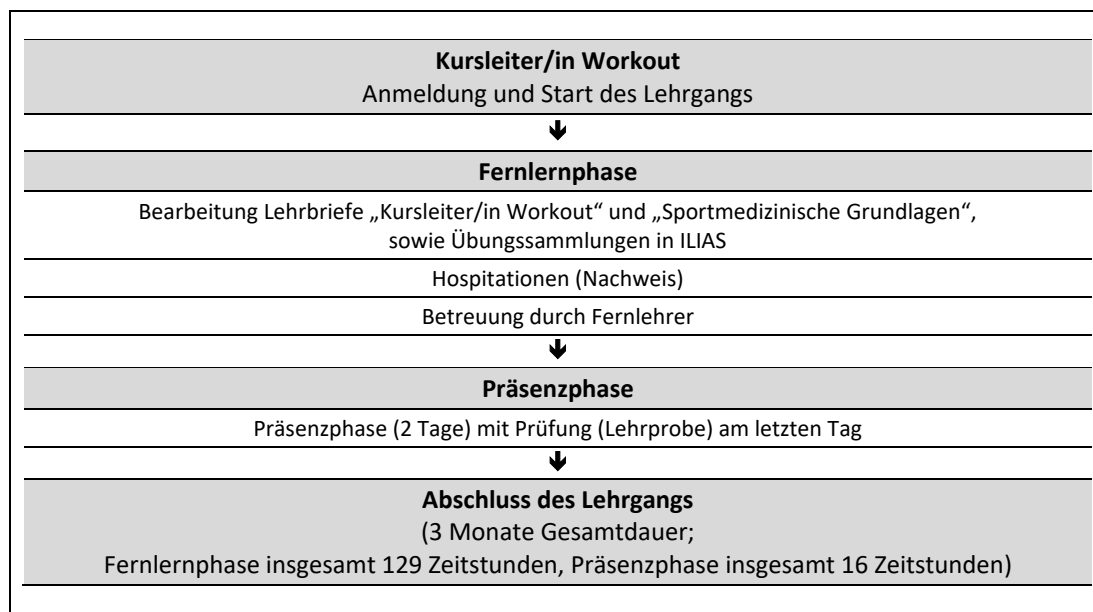
Abb. 1: Zeitliche Abfolge der Lernphasen

Die Regeldauer des Fernlehrgangs Kursleiter/in Workout beträgt insgesamt 3 Monate. Eine Verlängerung der Gesamtdauer ist grundsätzlich auf das Doppelte der ursprünglichen Lehrgangsdauer ohne Angaben von Gründen und ohne Zusatzkosten möglich (bis maximal 6 Monate). Eine weitere Verlängerung der Lehrgangsdauer kann auf Antrag und unter Darlegung von Gründen im Individualfall gewährt werden. Im Falle einer zulässigen Verlängerung der Lehrgangsdauer, ist eine Betreuung durch die Fernlehrer (vgl. Kap. 3) in vollem Umfang ohne Zusatzkosten für Sie gewährleistet.