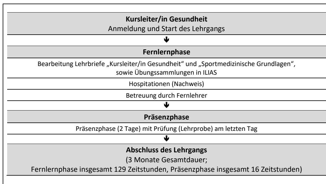
Abb. 1: Zeitliche Abfolge der Lernphasen

Die Regeldauer des Fernlehrgangs Kursleiter/in Gesundheit beträgt insgesamt 3 Monate. Eine Verlängerung der Gesamtdauer ist grundsätzlich auf das Doppelte der ursprünglichen Lehrgangsdauer ohne Angaben von Gründen und ohne Zusatzkosten möglich (bis maximal 6 Monate). Eine weitere Verlängerung der Lehrgangsdauer kann auf Antrag und unter Darlegung von Gründen im Individualfall gewährt werden. Im Falle einer zulässigen Verlängerung der Lehrgangsdauer, ist eine Betreuung durch die Fernlehrer (vgl. Kap. 3) in vollem Umfang ohne Zusatzkosten für Sie gewährleistet.