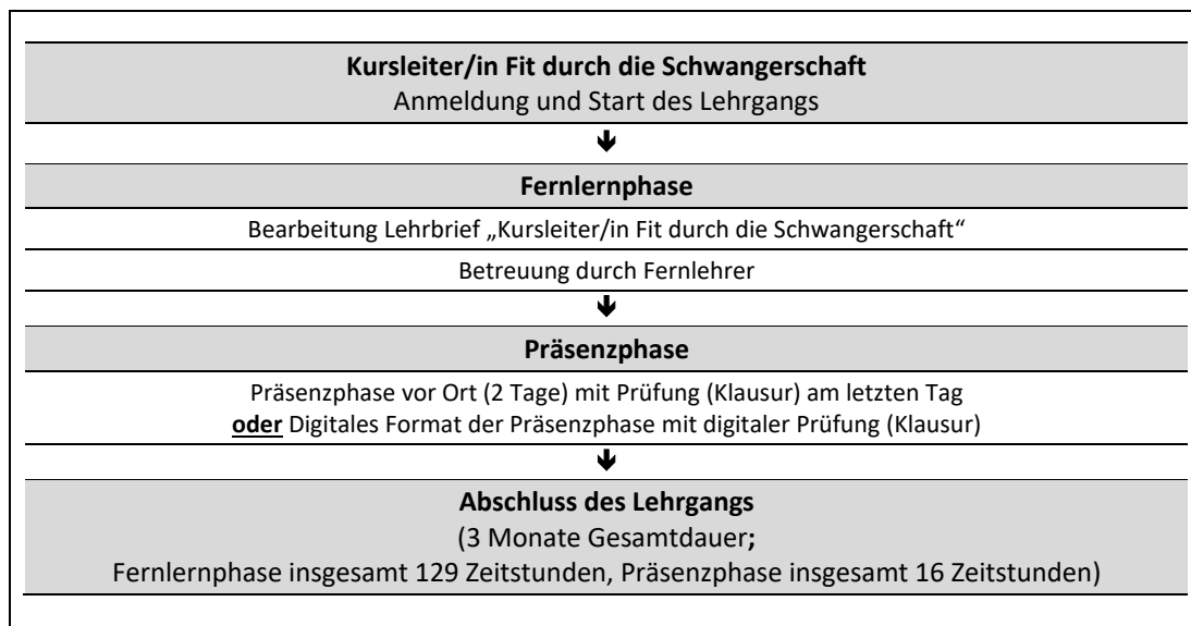
Abb. 2: Zeitliche Abfolge der Lernphasen

Die Regeldauer des Fernlehrgangs Kursleiter/in Fit durch die Schwangerschaft beträgt insgesamt 3 Monate. Eine Verlängerung der Gesamtdauer ist grundsätzlich auf das Doppelte der ursprünglichen Lehrgangsdauer ohne Angaben von Gründen und ohne Zusatzkosten möglich (bis maximal 6 Monate). Eine weitere Verlängerung der Lehrgangsdauer kann auf Antrag und unter Darlegung von Gründen im Individualfall gewährt werden. Im Falle einer zulässigen Verlängerung der Lehrgangsdauer, ist eine Betreuung durch die Fernlehrer (vgl. Kap. 4) in vollem Umfang ohne Zusatzkosten für Sie gewährleistet.