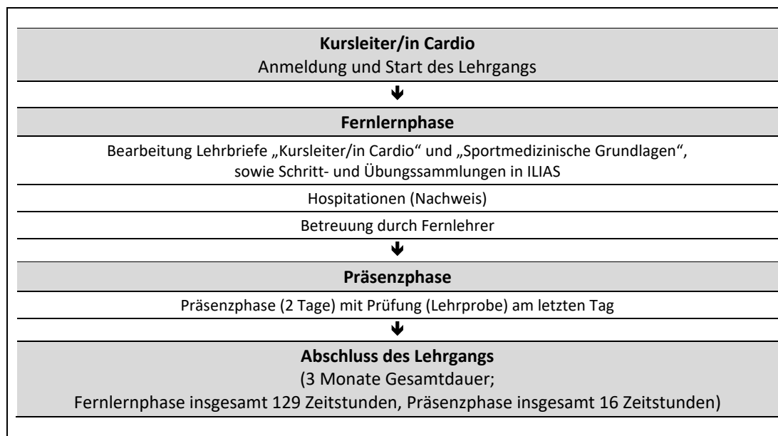
Abb. 1: Zeitliche Abfolge der Lernphasen

Die Regeldauer des Fernlehrgangs Kursleiter/in Cardio beträgt insgesamt 3 Monate. Eine Verlängerung der Gesamtdauer ist grundsätzlich auf das Doppelte der ursprünglichen Lehrgangsdauer ohne Angaben von Gründen und ohne Zusatzkosten möglich (bis maximal 6 Monate). Eine weitere Verlängerung der Lehrgangsdauer kann auf Antrag und unter Darlegung von Gründen im Individualfall gewährt werden. Im Falle einer zulässigen Verlängerung der Lehrgangsdauer, ist eine Betreuung durch die Fernlehrer (vgl. Kap. 3) in vollem Umfang ohne Zusatzkosten für Sie gewährleistet.