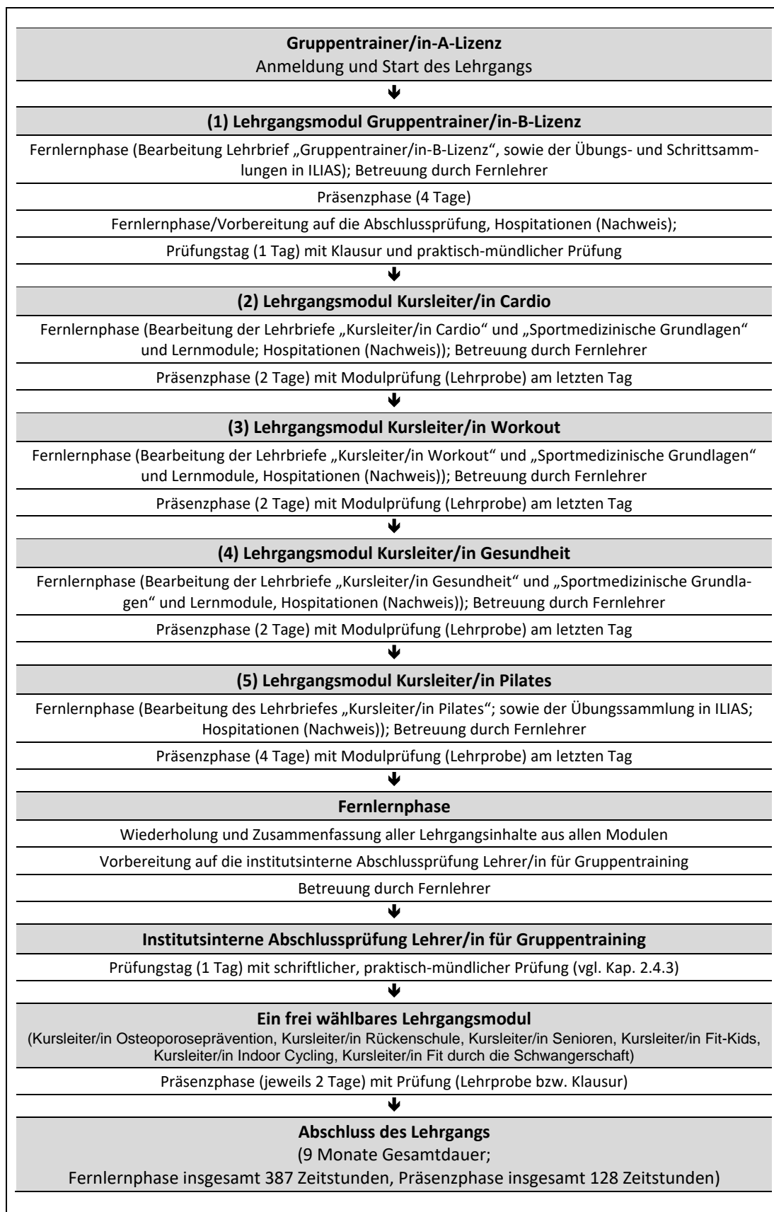
Abb. 1: Zeitliche Abfolge der Lehrgangsmodule und deren Lernphasen (inkl. Lernmedien und Präsenzphasen der Module)