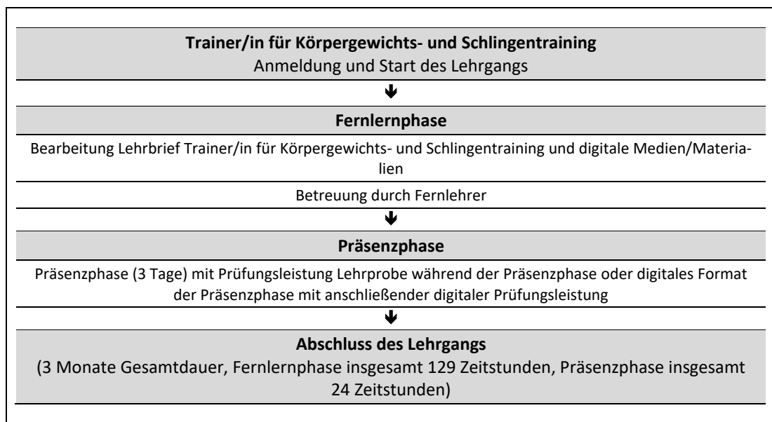
Abb. 2: Zeitliche Abfolge der Lernphasen

Die Regeldauer des Fernlehrgangs Trainer/in für Körpergewichts- und Schlingentraining beträgt insgesamt drei Monate. Eine Verlängerung der Gesamtdauer ist grundsätzlich auf das Doppelte der ursprünglichen Lehrgangsdauer ohne Angaben von Gründen und ohne Zusatzkosten möglich (bis maximal 6 Monate). Eine weitere Verlängerung der Lehrgangsdauer kann auf Antrag und unter Darlegung von Gründen im Individualfall gewährt werden. Im Falle einer zulässigen Verlängerung der Lehrgangsdauer, ist eine Betreuung durch die Fernlehrer (vgl. Kap. 4) in vollem Umfang ohne Zusatzkosten für Sie gewährleistet.