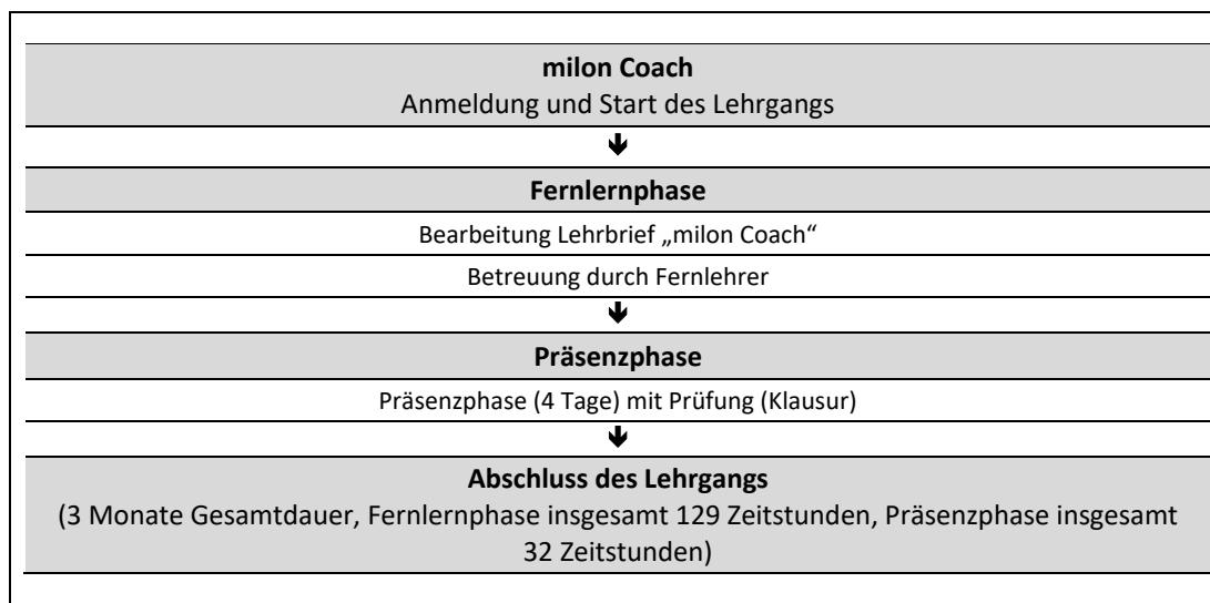
Abb. 1: Zeitliche Abfolge der Lernphasen

In Ihrem Fernlehrgang wird ein Lehrbrief als zentrales Lernmedium eingesetzt (vgl. Abb. 1 und Kap. 2.1).