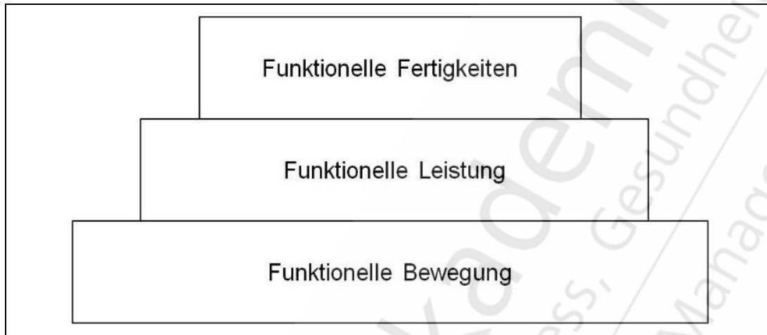
Abb. 2: Die optimale Bewegungspyramide (modifiziert nach Cook & Burton, 2010, S. 222; Cook, 2011, S. 35)

2011, S. 34). Die dritte Stufe beinhaltet die spezifischen Fertigkeiten (sportartspezifische Technik, Beherrschung sportart- oder berufsspezifischer Bewegungsabläufe). Die Abb. 2 stellt eine optimale Bewegungspyramide nach dem Ansatz von Cook (2011, S. 35) bzw. Cook und Burton (2010, S. 222) dar.